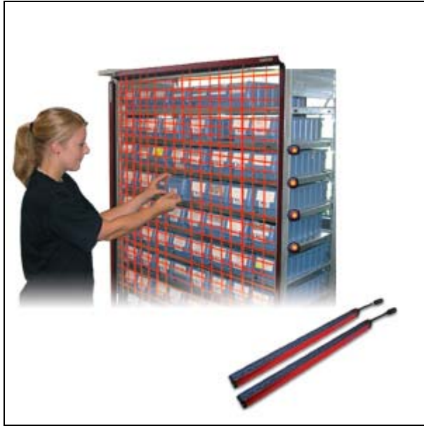
Poka Yoke mit dem Lichtvorhang Object100