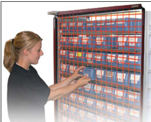
Poka-Yoke-Regal ausgerüstet mit Object 100

Mit freundlichen Grüßen Hannes Schumacher