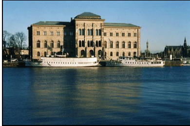
Das schwedische Nationalmuseum in Stockholm

Bei Fragen stehe ich Ihnen jederzeit gerne zur Verfügung (+41 (0)81 307 23 98). Ich danke Ihnen jetzt schon für Ihr Interesse. Freundliche Grüsse Hannes Schumacher